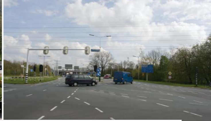
Nu kan het nog, straks niet meer: vanaf de Hendrik ter Kuilestraat de Auke Vleerstraat op

lange wachtrijen bij de verkeerslichten worden voorkomen. Het verkeer vanaf de Hendrik ter Kuilestraat moet een andere route kiezen: via de Schiffstraat en De Hoeveler kan dat verkeer komen op de Auke Vleerstraat. De aansluiting van De Hoeveler wordt een groot geregeld kruispunt waar voldoende capaciteit wordt gerealiseerd om het verkeer van en naar het Havengebied een goede doorstroming te kunnen bieden. De Hendrik ter Kuilestraat gaan we voortzetten als rondweg rondom het Havengebied. Die loopt door tot het Avia tankstation en sluit daar aan op de bestaande wegen. We zijn nog aan het studeren hoe we het probleem het beste op kunnen lossen voor de fietsers die willen oversteken op dat punt.'